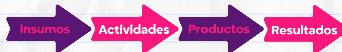
Gráfico 1. Estructura cadena de valor

En la estructura de la cadena de valor se relacionan los insumos, entendidos como los factores de producción que se transforman a través de procesos (actividades), para obtener los bienes o servicios (productos) que se entregarán a la población con el propósito de solucionar una situación específica que conlleve a una mejora de bienestar (resultados).